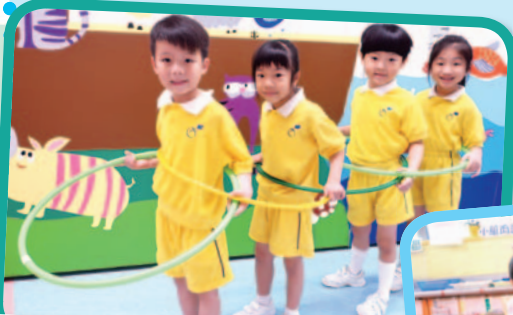
看，我們設計的遊戲多好玩！