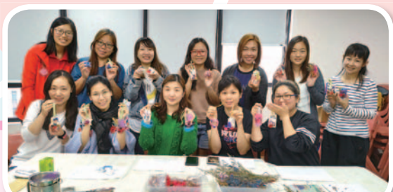
週三閒情—乾花蠟掛牌DIY