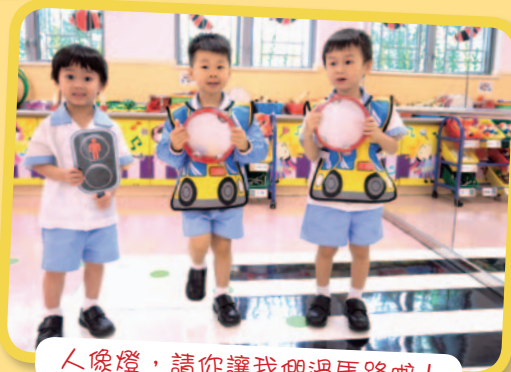
人像燈，請你讓我們過馬路啦！