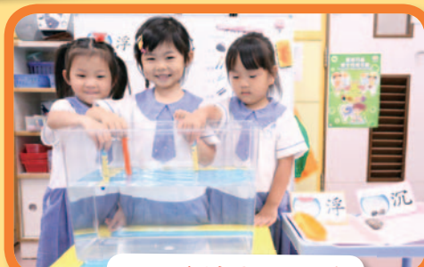
浮沉實驗很好玩呀！