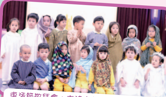
復活節敬拜會：主被人釘十架，是是是。