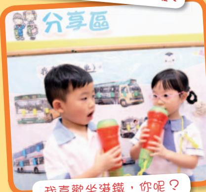
我喜歡坐港鐵，你呢？