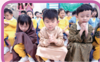
復活節敬拜會：在小話劇前齊心禱告。