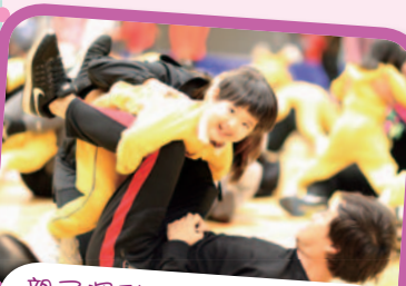
親子運動會：爸爸和我玩遊戲，好玩呀！