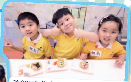
我們製作的水果樽 Yummy Yummy!