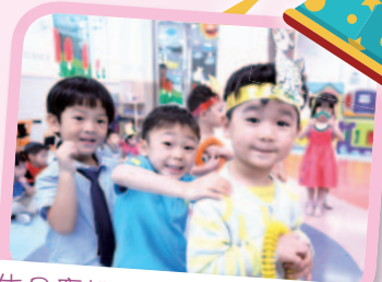
生日慶祝會：玩遊戲真開心。