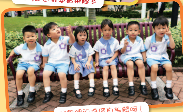
公園裡的環境真美麗啊！