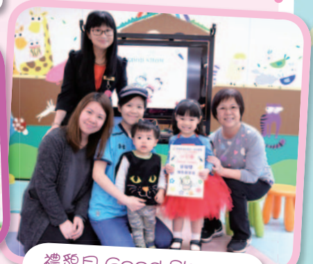
禮貌月 Good Show：謝謝禮貌超人一家的演出。