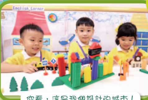
你看，這是我們設計的城市！