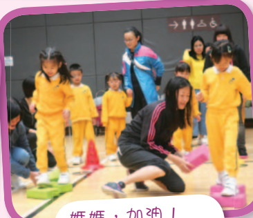
媽媽，加油！一起快快往終點！