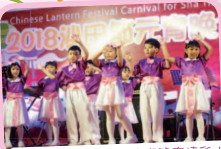
沙田元宵晚會：孩子的表演真精彩！