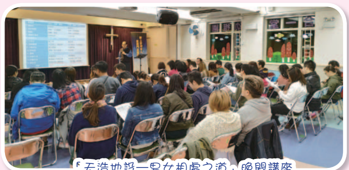
「天造地設—男女相處之道」晚間講座