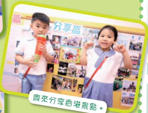
齊來分享香港景點。