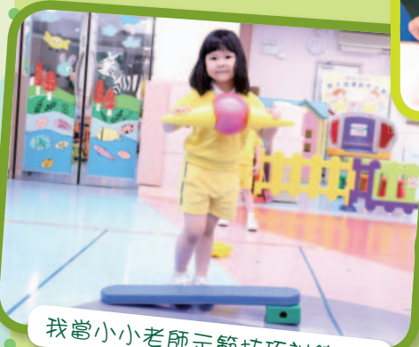
我當小小老師示範技巧訓練嘅！