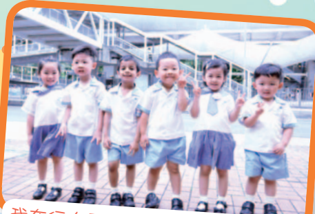
我在行人天橋看到好多交通工具呀！