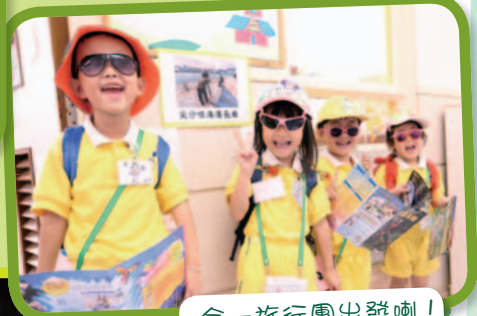
合一旅行團出發喇！