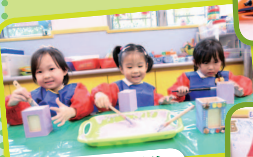
我們認真地為爸爸 準備父親節禮物。