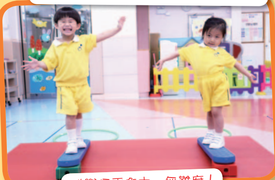
挑戰行平衡木，無難度！