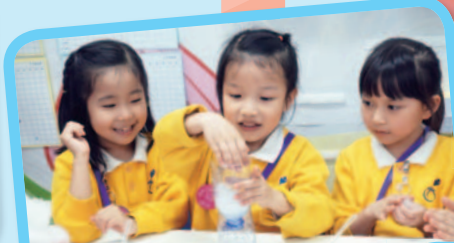
小小科學家： 自製濾水器淨化污水。