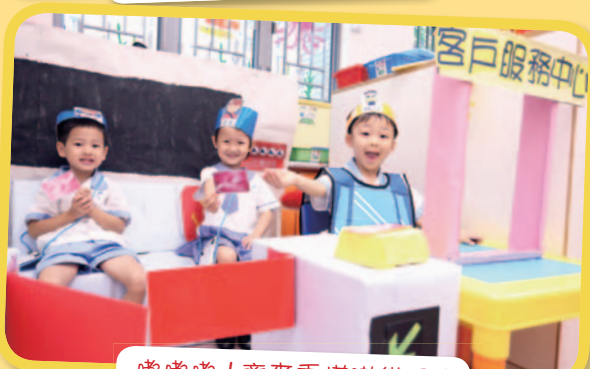
噹噹噹！齊來乘塔港鐵吧！