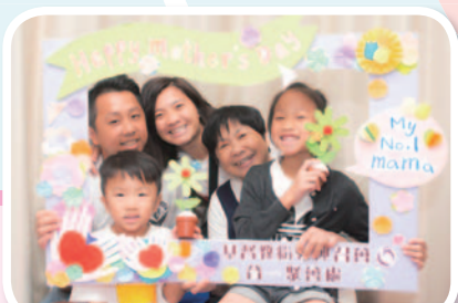
母親節親子福音主日「拍攝家庭照」

18/9-23/10 「優質家長組」(上午、下午) 25/10-29/11 「優質家長組」(晚間)