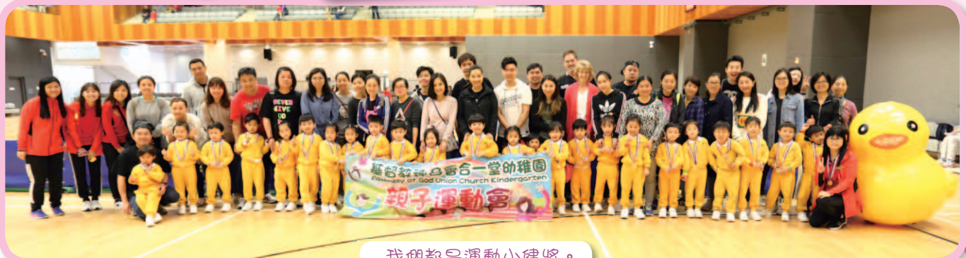
我們都是運動小健將。