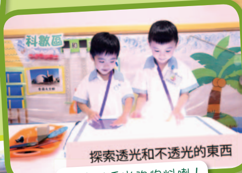
探索透光和不透光的東西 我找到透光的物料喇！