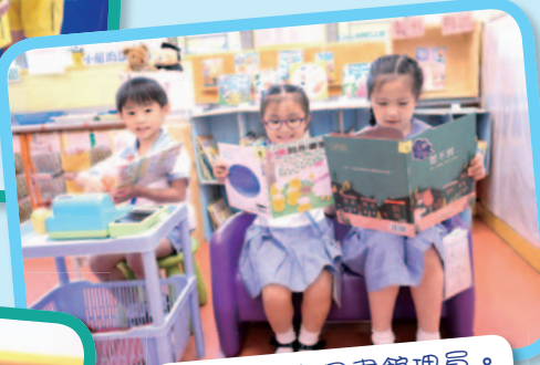
體驗當小小圖書館員。