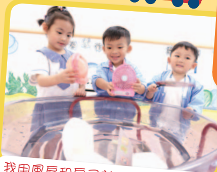
我用風扇和扇子就可以移動小船啦！