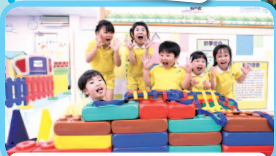
來玩玩我們自己創作的遊戲，很有趣喇！