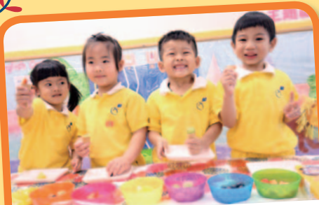
水果好味又有益，我們都愛吃水果！