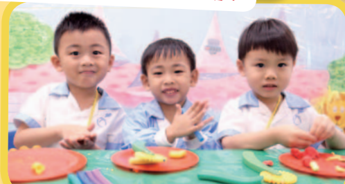
搓！搓！搓！搓泥膠！齊來發揮創意吧！