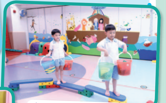
赤足行體驗山區兒童勞苦的生活。