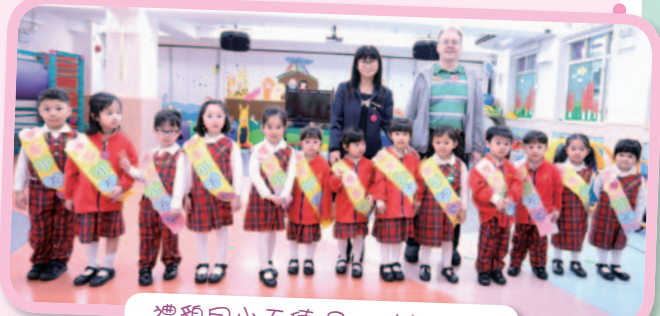
禮貌月小天使 Say Hello！