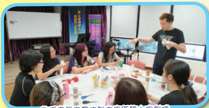
教授家長用廢物製作廁紙筒十字劍球

Facebook: 環保爸爸的創意生活 https://www.facebook.com/stemhomehk/