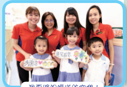
我要將祝福送給你們！