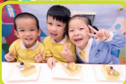
水果蛋糕健康又好味！