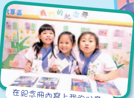
在紀念冊內寫上我的心意。