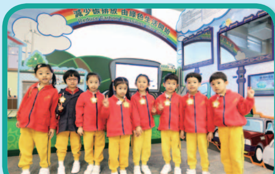
我們學到很多環保資訊呀！實行環保生活啦！