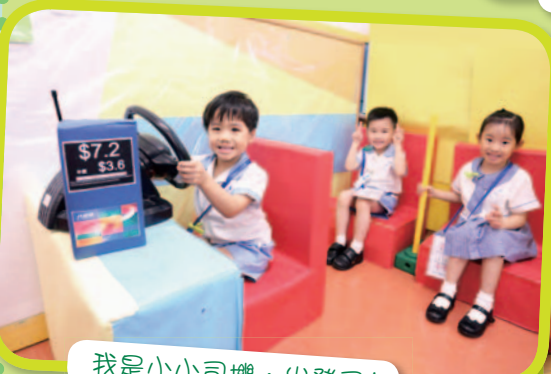
我是小小司機，出發了！