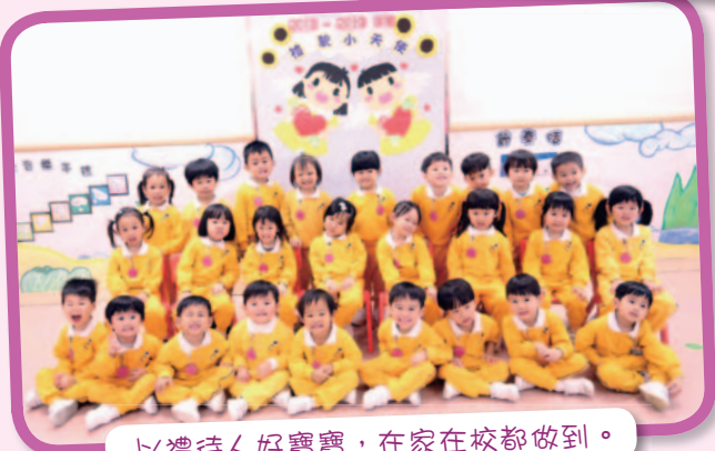
以禮待人好寶寶，在家在校都做到。