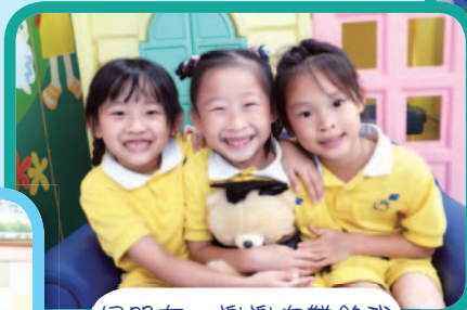
好朋友，謝謝你帶給我 許多歡樂！