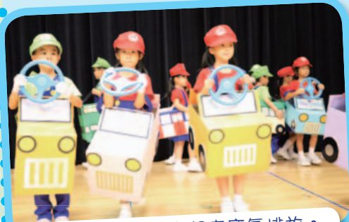
環保第一！減少駕車廢氣排放。