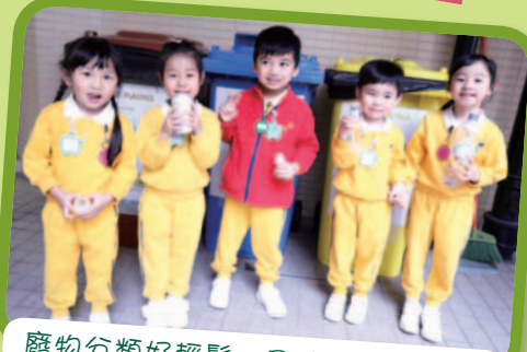
廢物分類好輕鬆，回收你我做得到。