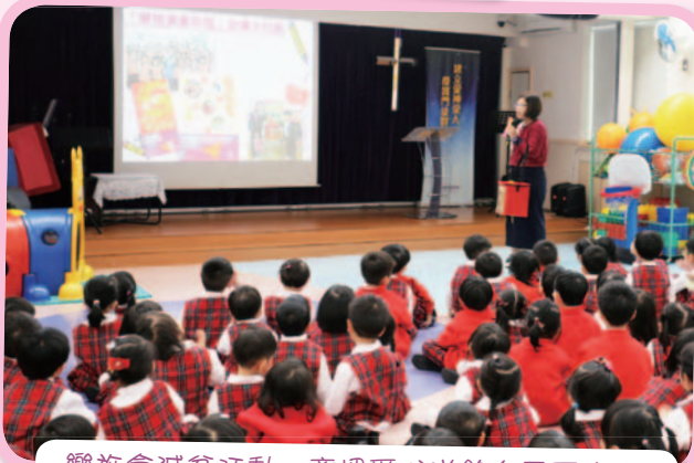
樂施會減貧活動：齊把愛心送給有需要的人。